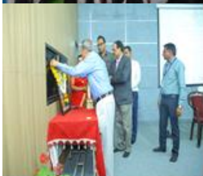
One Day Workshop on "Revolutionizing Agro-Based Technology for Viksit Bharat" on 15 th March, 2024